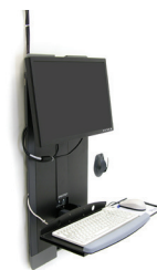
Chambre du patient